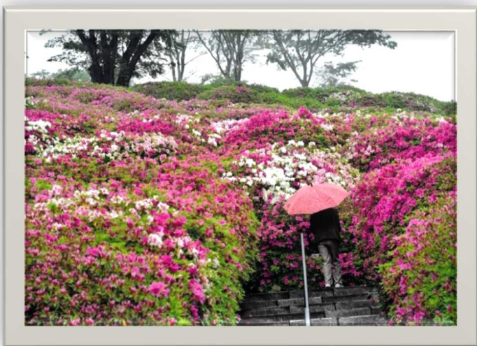
武山連合町内会長賞「雨の日 つつじを見る」古谷 憲一